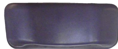
Innovation Regal Spas

Bien plus qu'un simple oreiller, AquaRest est un rouleau-masseur du cou et des épaules. Développé et breveté par nos équipes, il est uniquement disponible au Regal Spas