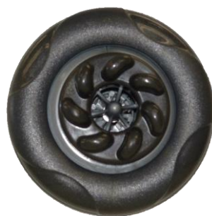
Innovation Regal Spas

Appareil unique d'hydrothérapie, le Vibra Jet a été développé par nos équipes afin de fournir un jet d'eau vibrant grâce à l'ajutage de la pression d'eau. Cette sensation ne peut être vécue que par les utilisateurs de Régal Spas