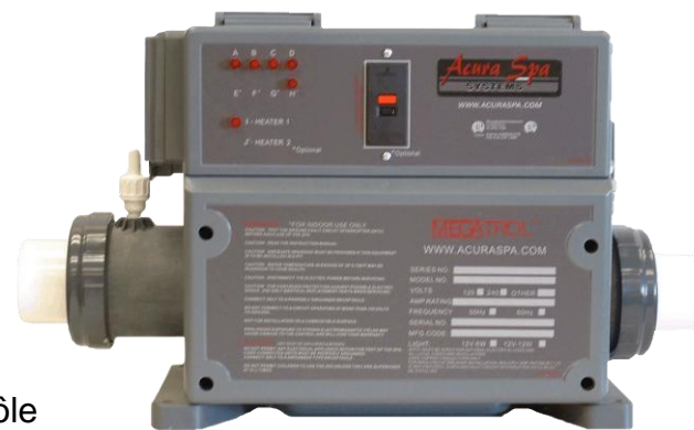
Innovation Regal Spas

25 ans d'expérience dans la production de chauffages, pompes et équipements pour les stations thermales.