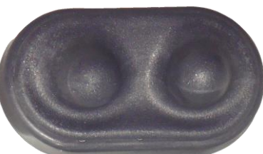
Innovation Regal Spas