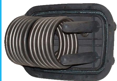
Innovation Regal Spas