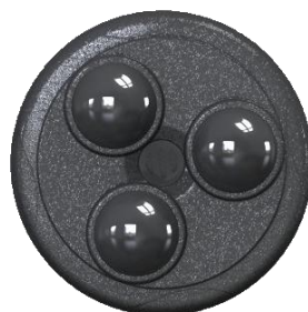
Innovation Regal Spas

Produit révolutionnaire, le Robussage, également développé par nos équipes, propose un massage grâce au contact direct de ses 3 billes tournantes avec le corps. Agissant comme les doigts d'un masseur, le Robussage masse fermement les muscles fatigués et tendus, permettant ainsi de desserrer les nœuds et soulager la tension du muscle. Il peut aussi bien être installé pour fournir un résultat pour le bas du dos, les épaules ou le cou.