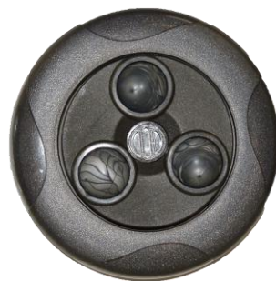
Innovation Regal Spas